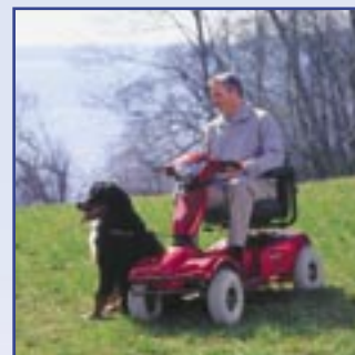
Perfeita para o exterior: