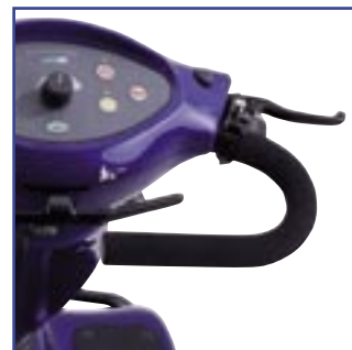
O travão de mão pode ser usado tanto como travão de estacionamento ou como travão normal.