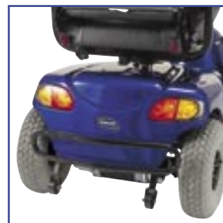
Novo estilo de sistema de luzes aprovado pelas mais recentes normas de iluminação.